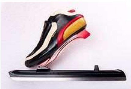
Конькобежные коньки—клапы системы Viking