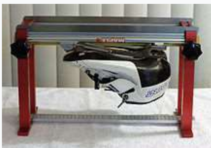
Станок для заточки беговых коньков

Конькобежцы в классическом беге соревнуются в специальных комбинезонах и бегут на коньках—кляпах . Разрешено использовать шлем, повторяющий форму головы. Аэродинамические шлемы и радио аппаратура запрещены [4] . У коньков—клапов (англ. - clap skate ), появившихся в 90-х годах XX века, имеется лезвие с шарниром в передней части и подпружиненной задней частью. Это позволяет лезвию двигаться относительно ботинка, создавая дополнительную длину отталкивания и увеличивая тем самым скорость. Своё название «клап» коньки получили за характерный звук (англ. clap - хлопок), который издаёт лезвие, когда после толчка спортсмена пружина возвращает его обратно к ботинку.