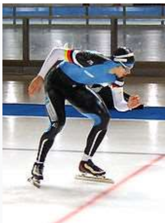
Конькобежец на старте