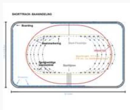
Разметка для забегов в шорт-треке

Беговая дорожка для конькобежного спорта в классическом варианте представляет собой овал длиной либо 400, либо 333.3 метра. Все крупные соревнования проходят исключительно на дорожках длиной 400 метров. Радиус внутреннего поворота составляет от 25 до 26 метров. Длина каждой прямой и длина каждого поворота около 100 метров. [3]